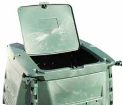
Ouverture petit couvercle