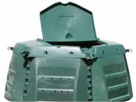
Ouverture du demi couvercle 1000 L