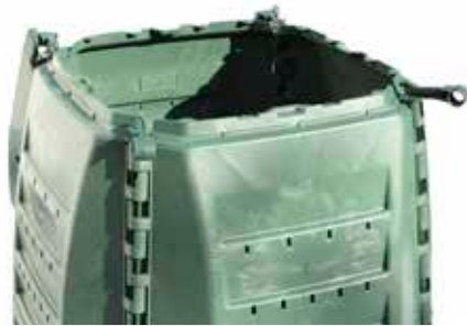
Ouverture grand couvercle

Fixer le couvercle sur les cornières, assembler les 2 parties à l'aide des vis.